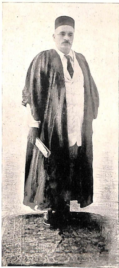
वर्धा येथे वकिलाच्या वेषांत (सन १९२०)