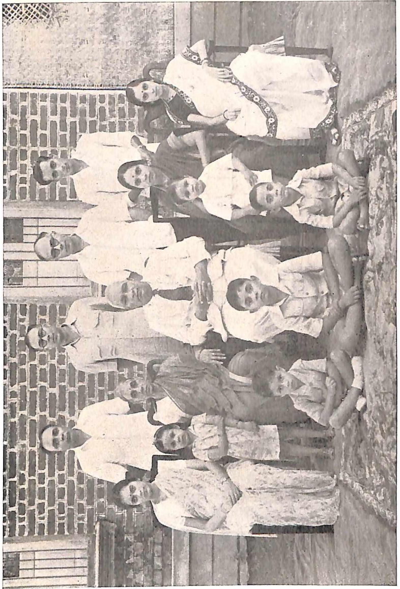
कुटुंबियांसह (सन १९४७)