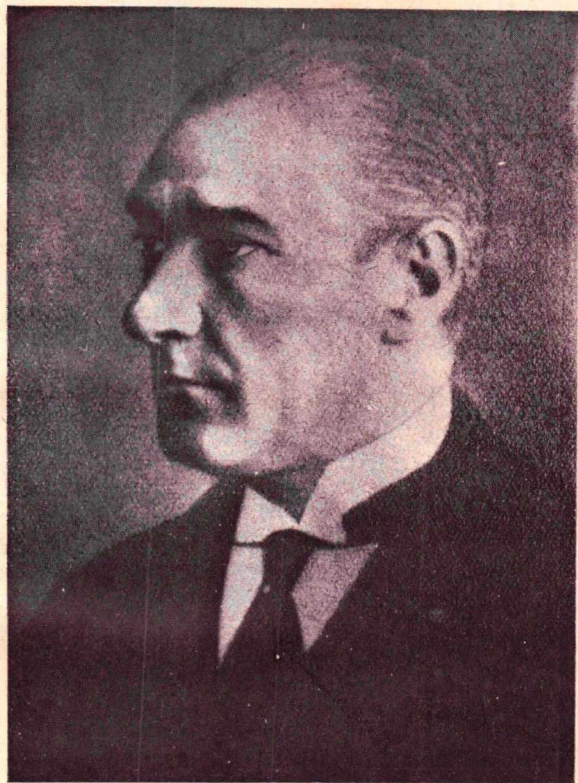
अतातुर्क कमाल पाशा