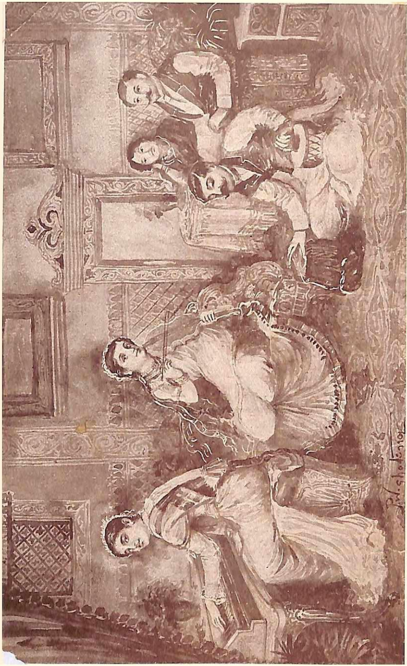
श्रीला—नाहीं, ही उद्योगी—सत्यवान उर्फ प्रेमसंसार नाटकाची